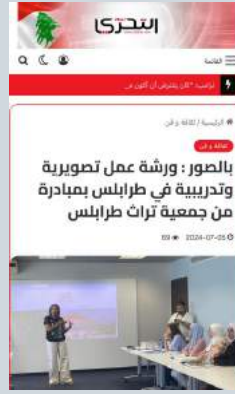
ورشة عمل تصويرية وتدريبية في طرابلس بمبادرة من جمعية تراث طرابلس وأجمل بلدات لبنان