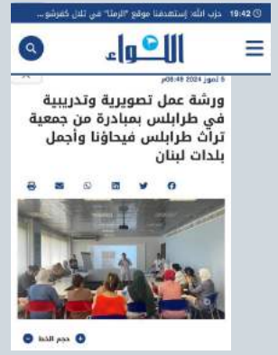
ورشة عمل تصويرية وتدريبية في طرابلس بمبادرة من جمعية تراث طرابلس وأجمل بلدات لبنان