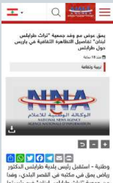
يقيم عرض مع وفد جمعية "تراث طرابلس لبنان" تفاصيل التظاهرة الثقافية في باريس حول طرابلس