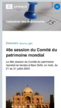
46e session du Comité du patrimoine mondial