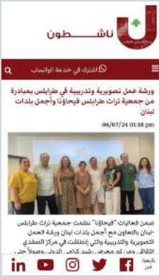
ورشة عمل تصويرية وتدريبية في طرابلس بمبادرة من جمعية تراث طرابلس وأجمل بلدات لبنان