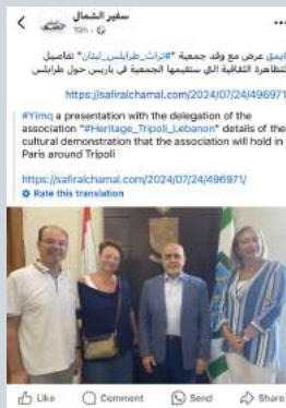
يقيم عرض مع وفد جمعية "تراث طرابلس لبنان" تفاصيل التظاهرة الثقافية في باريس حول طرابلس