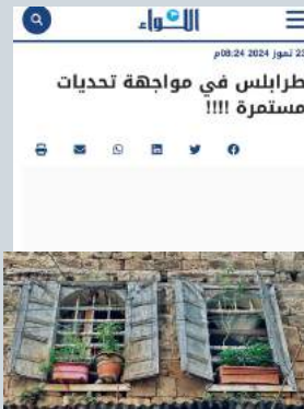
طرابلس في مواجهة تحديات مستمرة!!!