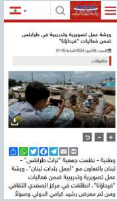
ورشة عمل تصويرية وتدريبية في طرابلس ضمن فعاليات "فيحاؤنا"