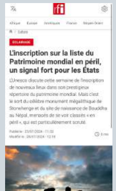
L'inscription sur la liste du Patrimoine mondial en péril, un signal fort pour les États