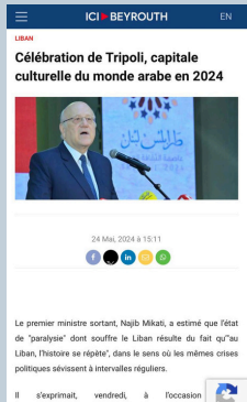
Célébration de Tripoli, capitale culturelle du monde arabe en 2024