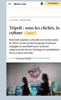
Tripoli : sous les clichés, la culture