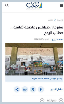
مهرجان طرابلس عاصمة ثقافية... خطاب الريح