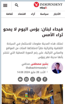
فيحاء لبنان: بؤس اليوم لا يمحو ثراء الأمس