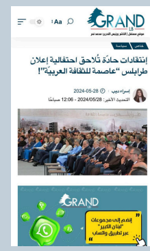
انتقادات حادة تلاحق احتفالية اعلان طرابلس "عاصمة للثقافة العربية"!