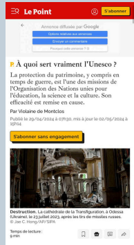
À quoi sert vraiment l'Unesco