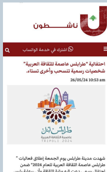
إحتفالية "طرابلس عاصمة للثقافة العربية" شخصيات رسمية تنسحب وأخرى تستاء