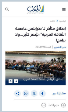
إطلاق متأخر لـ "طرابلس عاصمة الثقافة العربية"؛ يشعر كثير... ولا برامج!