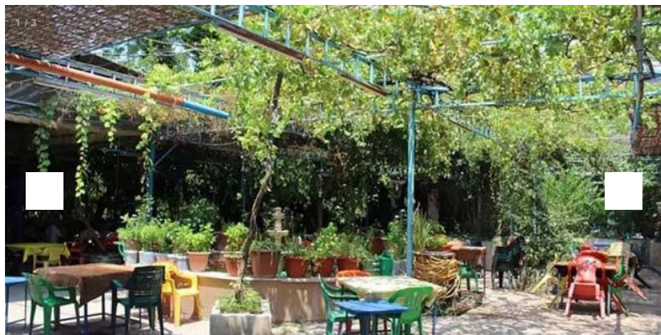
Le café du Tell où il fait bon siroter une limonade.